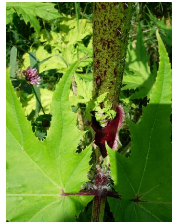
Heracleum mantegazzianum : Stängel mit roten Flecken

Blätter bis zum Mittelnerv eingeschnitten → erscheinen zusammengesetzt Blatteile gegen oben abgerundet.